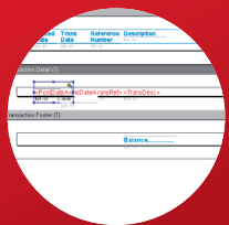
Formatage de la ligne de transaction