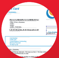
Aperçu du relevé (première page)

Produire directement les documents ou regrouper et envoyer le projet à l'aide de l'utilitaire Pack N Go