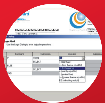
Boîte de dialogue de logique conditionnelle