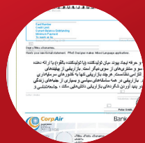
Multi-langue incluant l'arabe